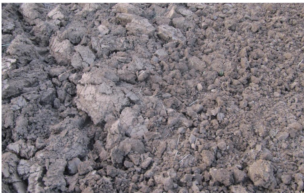
Obr. 3: Půda po orbě (vlevo) a zpracování půdy kompaktozem

Při orbě a hlubokém kypření dochází kromě ztrát vody z půdy také k vyšším emisím CO 2 v důsledku intenzivnějšího rozkladu organických látek, které je třeba vracet do půdy ve větším množství než při pásovém nebo redukovaném plošném zpracování půdy. To můžeme kromě klasického organického hnojení např. hnojem splnit také pěstováním vyšších nepoléhavých odrůd řepky, po kterých zůstává na poli více slámy v kombinaci s mulčováním a co nejpozdějším (při zohlednění fytopatologických rizik) zapravením do půdy pokud možno v chladnějším období, abychom omezili rozklad půdní organické hmoty. V návaznosti na Zelenou dohodu EU budou v příštích letech ve větší míře používány při zakládání porostů řepky v teplém letním období konzervační půdoochranné technologie s minimálním zpracováním půdy (pásově zpracování, mělké kypření s prohloubením jen v řádcích, setí do mulče apod.).