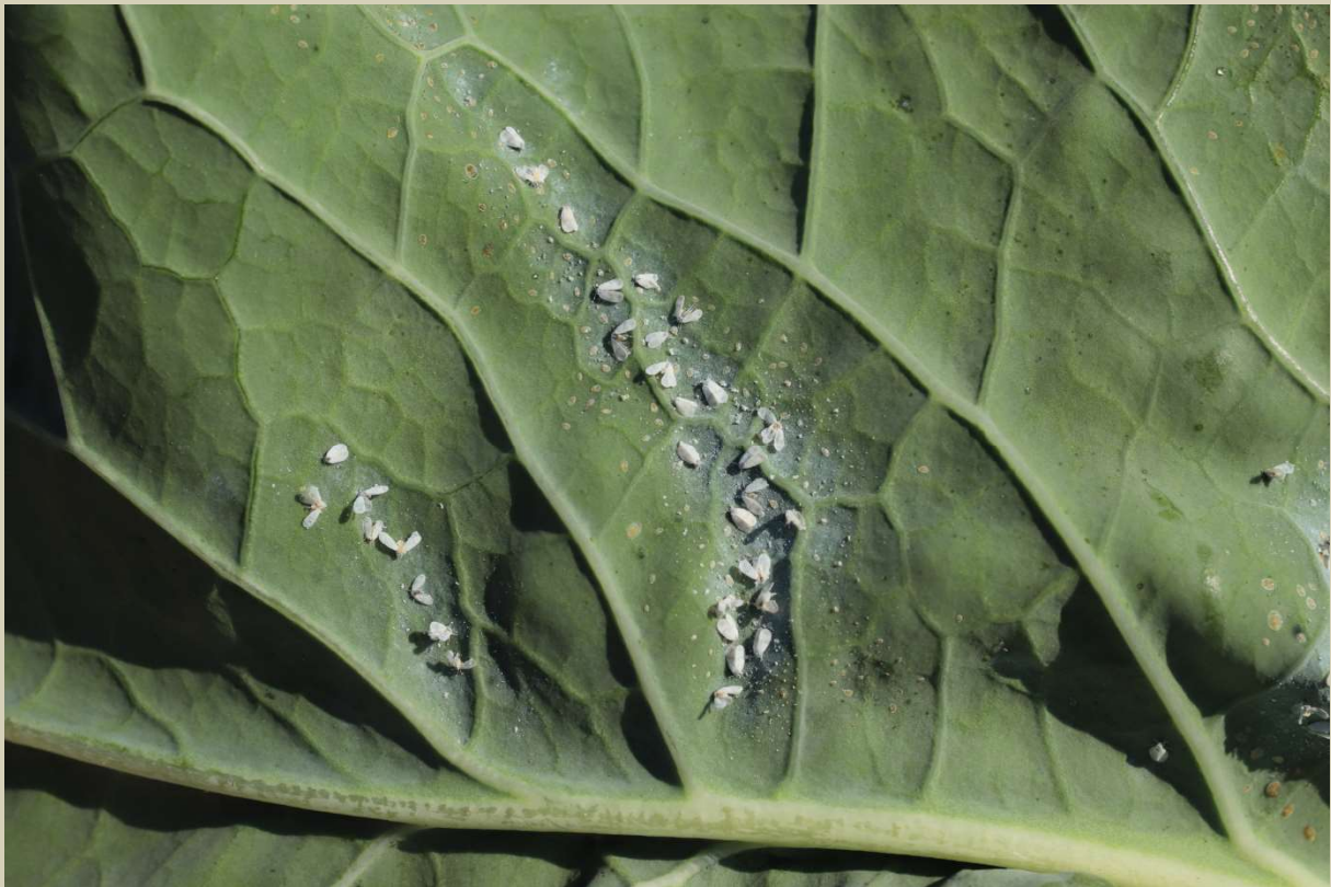
Molice stále přítomna včetně nejmladších vývojových stádií