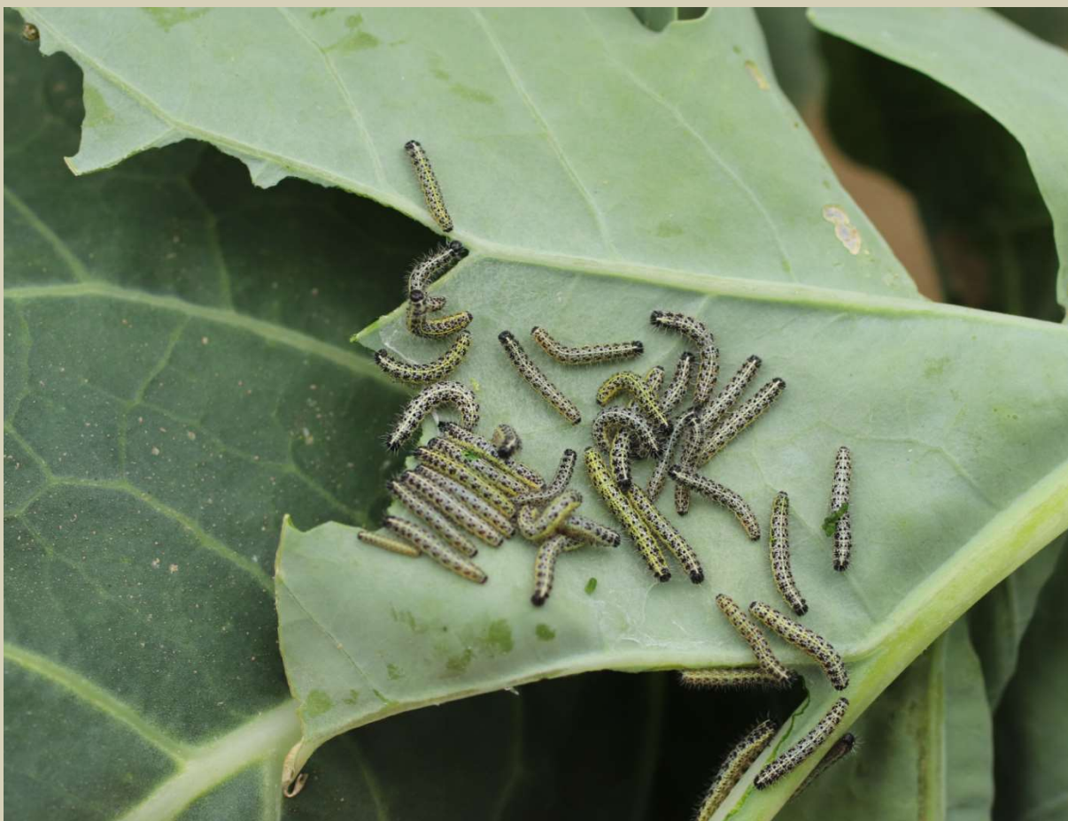
Vzácně se objevují i housenky bělásky zelného