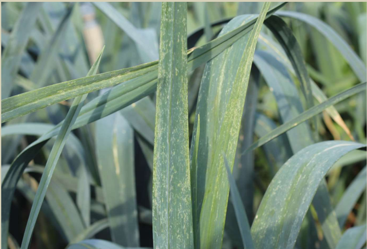
Poškození póru třásněnkami