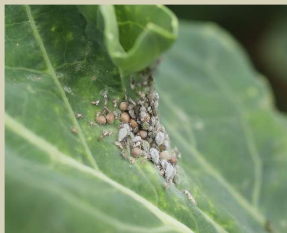
Kolonie m. zelné s mšicomaři

Výskyt velmi nízký, na polích pouze mšicomaři a občas pavouci.