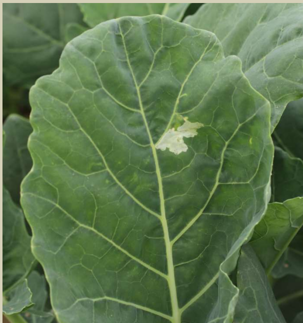
Poškození listů od zápředníčka (vlevo) a vrtalky