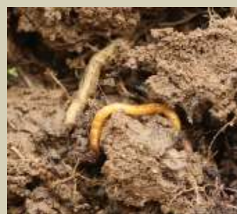
Rizikové - mšice, molice, housenky zápředníčka, můr a běláška, drátovci, dřepčící